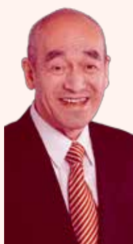
立花 しゅんじ議員