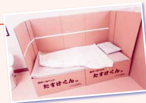
避難所ダンボールベッド

仮設住宅、そして、自力での仮設住宅などへの補助金をつくり、復興生活で命をなくすことが無い政策を求めました。