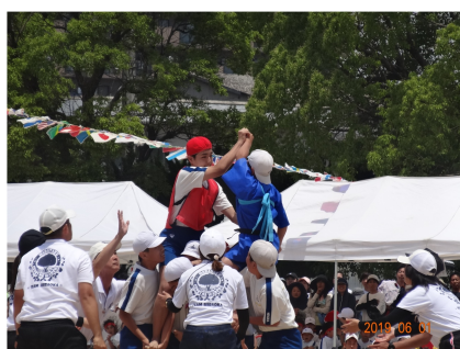
3色対抗の騎馬戦で力を込めて闘う子どもたち

6月1日、平岡小学校で運動会が開催されました。好天にも恵まれ、力いっぱい演技に魅了されました。また、赤・青・黄の3色対抗の応援合戦も熱が入り、子どもたちの元気な声が校庭に響きわたりました。