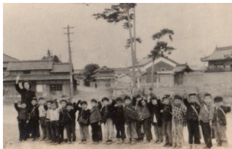
写真は平岡小学校から見た西谷厄神 1953年（昭和28年）卒園記念

閉鎖した土山のマルアイ跡にスキ 薬局が入り、高畑のマックスバリ ュ西にトヨタの営業所が建設中です。