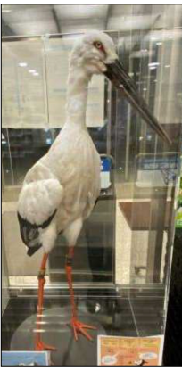
展示中の剥製

このところ、目撃情報が相次いで いるコウノトリですが、東播県民局 によると、今年76羽が東播地区に飛 来、天満大池では15羽、原血池では 20羽の集団も目撃されたそうです。 県民局入り口には剥製が展示され ていますが、その大きさは驚きです。