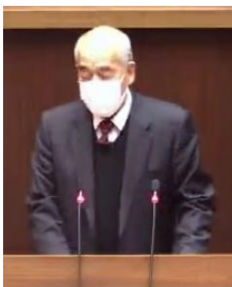
質問する立花市議

かない生活困窮者に財政基金を活用した市独自の対策を求めました。国保料均等割の軽減を