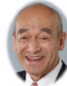
立花 俊治 加古川市議会議員